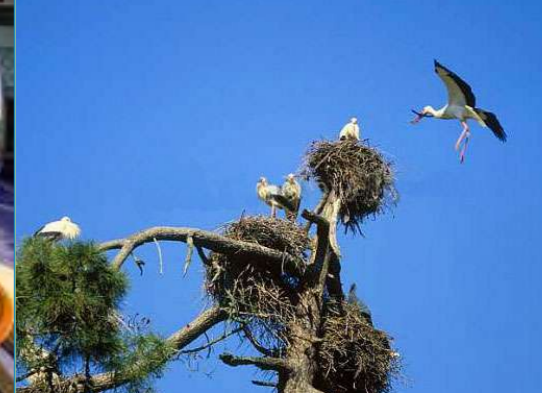
Praia da Comporta